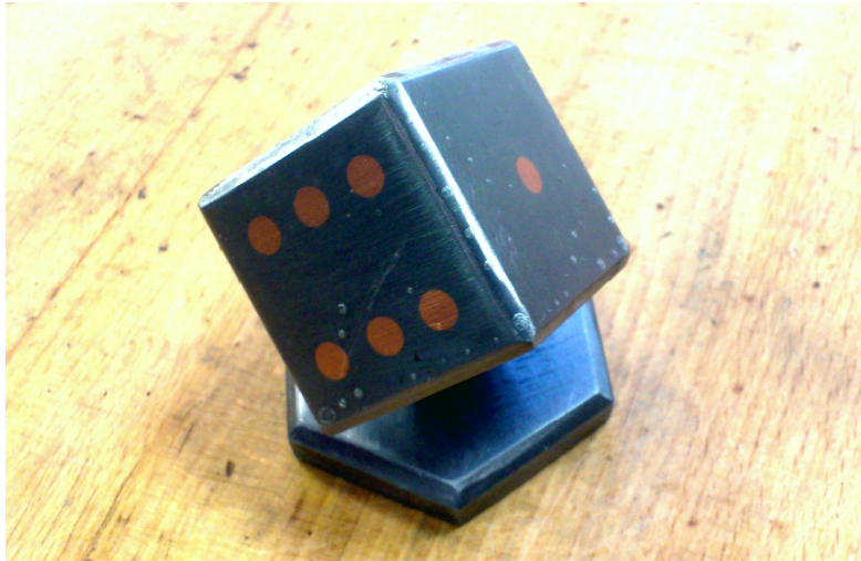
Projektarbeit - Briefbeschwerer