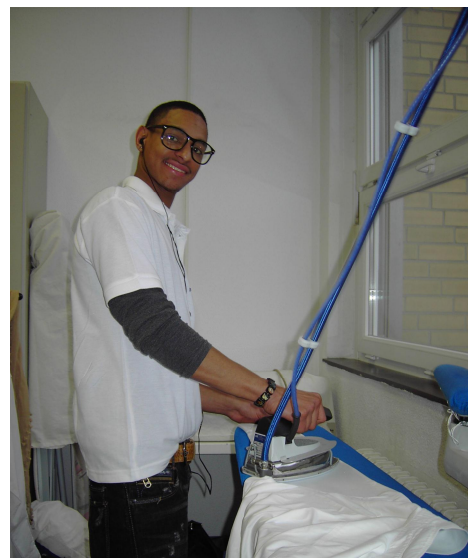
Bügeln auf der Bügelanlage