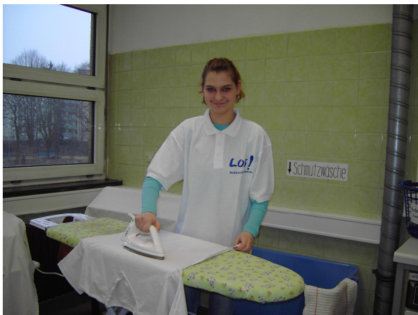
Bügeln auf dem Bügelbrett