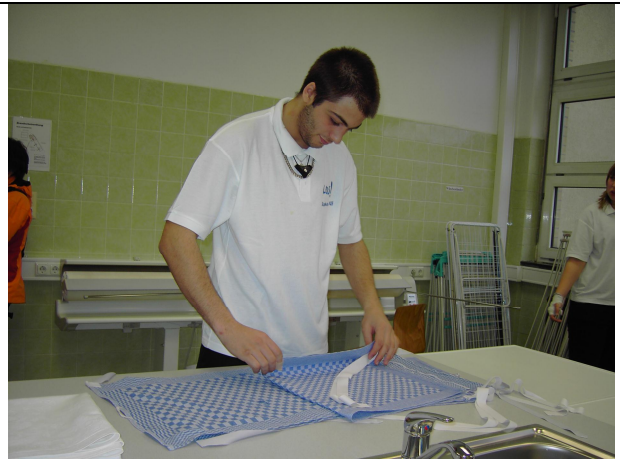
Legen von Küchenwäsche