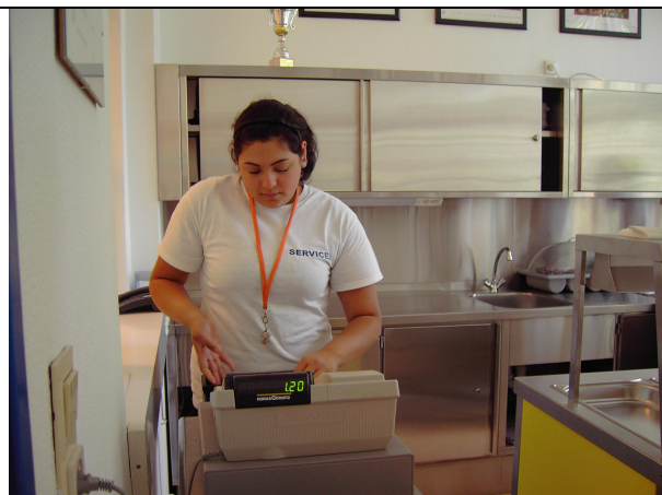
Kassentätigkeit im Bistro