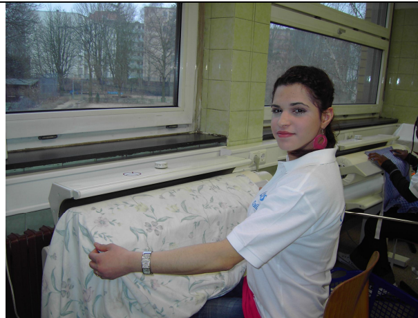
Mangeln von Tischwäsche