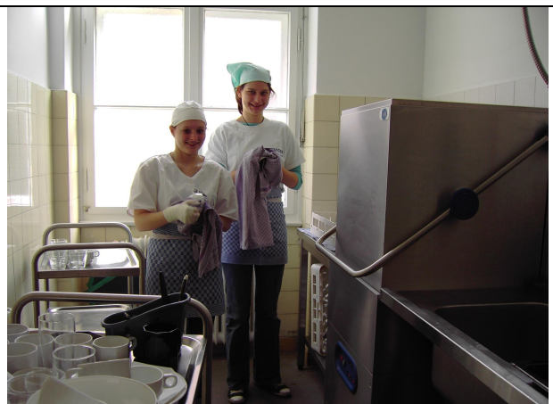
Spülen des Bistroschirrs